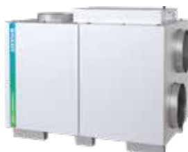
7 olika L-modeller