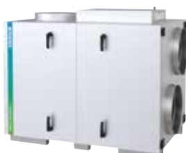
7 ulike L-modeller