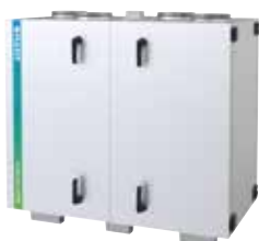
7 ulike S-modeller

ProNordic-serien vil finnes i 14 ulike modeller med luftmengde fra 780 m 3 /h til 6000 m 3 /h.